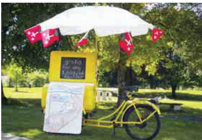
Das Glacévelo lockte als «eye-catcher» und mit seinem Versprechen «Glacé gegen Mitarbeit am Leitbildtisch».

Die Rückmeldungen aus der Bevölkerung waren erfreulicherweise noch zahlreicher als vom Projektteam erwartet. Im Anschluss daran wurde mit der Auswertung der Schreib- und Sprechstichtücher begonnen.