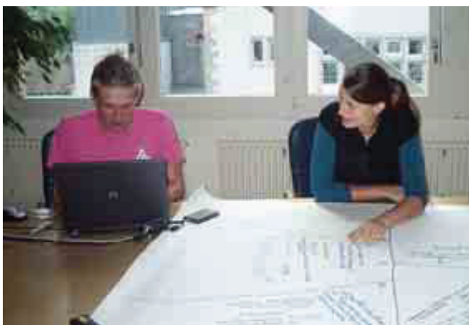
Die Projektgruppe hat nun damit begonnen, die Daten auf den einzelnen Tischen elektronisch zu erfassen.

Nach einer ersten Sichtung der Rückmeldungen kann die Projektgruppe erfreut feststellen: Es wurden von A wie Abfallproblemen bis Z wie Zusammenarbeit in der Region viele Zukunftsthemen angesprochen.