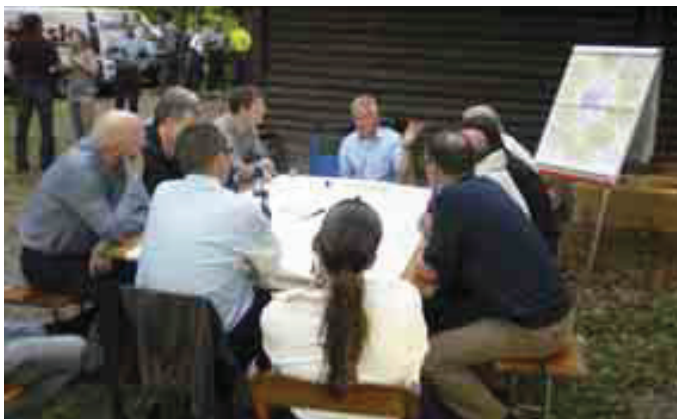
Das Projektteam konnte sich an fast allen Anlässen auf die Unterstützung des Wetters verlassen.